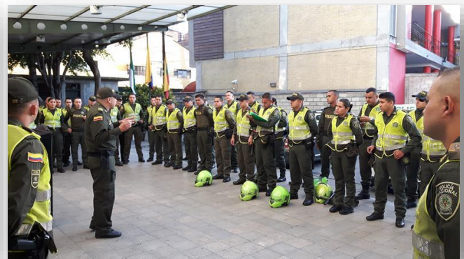
Foto 01 Visita Fuerte Militar LARANDIA Departamento del Caquetá